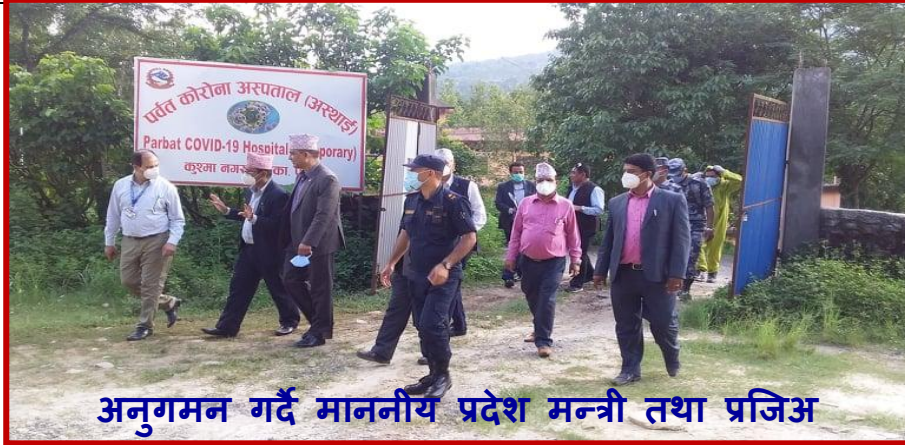
अनुगमन गर्दै माननीय प्रदेश मन्त्री तथा प्रजिअ

विदेशबाट आएकाहरुलाई PCR Negative भए पालिका मार्फत होम क्वारेन्टिन पठाइने गरिएको । Test नभएका वा RDT Positive वा Negative भएकालाई सदरमुकाम वा साझा क्वारेन्टिनमा राख्ने गरिएको । PCR Positive भए आइशोलेसन र Negative भए पालिकाको क्वारेन्टिनमा १४ र होम क्वारेन्टिनमा ७ दिन राख्ने गरि ब्यवस्था मिलाइएको । तर २०७७ असोज १ देखि सार्वजनिक यातयातका खुला भएपछि पालिकाहरुसंग बैठक समेत वसी जिल्ला प्रवेश गर्ने ब्यक्तिलाई सम्बन्धित पालिकाले व्यवस्था गरेको क्वारेन्टिन वा होम आइशोलेसनमा राख्ने ब्यवस्था मिलाएको।